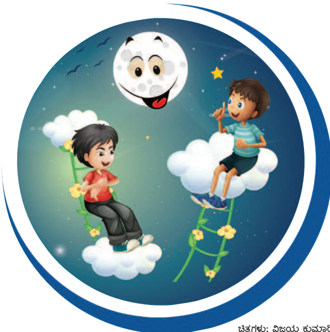
ಚಿತ್ರಗಳು: ವಿಜಯ ಕುಮಾರಿ

ಚೆನ್ನದ ನಾಡಿಗೆ ಹೊರಟೆವು ನಾವು ಕನ್ನಡ ಅಕ್ಷರವಾಗಲಿಕೆ! ಅಲ್ಲೆಲ್ಲರಿಗೂ ಸ್ವಂತದ ಭಾಷು ವ್ಯಷ್ಟಿ-ಸಮಷ್ಟಿಯ ಬೆಳಗಲಿಕೆ!