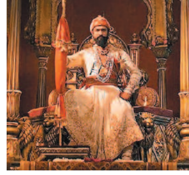
ಛಾವಾ ಚಿತ್ರದಲ್ಲಿ ವಿಕಿ ಕೌಶಲ್

ಮನೋಜ್ ಕುಮಾರ್, ಧರ್ಮೇಂದ್ರ ಗೋವರ್ಧನ್ ಅಸರಾನಿ, ಸತೀಶ್ ಶಾ, ಸುಲಕ್ಷಣಾ ಪಂಡಿತ್ ಅವರಂತಹ ನಟ-ನಟಿಯರು ಅಗಲಿದ ವರ್ಷವಿದು. ನಿರ್ಮಾಪಕ ಪ್ರೀತಿಶ್ ನಂದಿ ನಿಧನರಾದದ್ದೂ ಇದೇ ವರ್ಷ. ಸಿಂಗಪುರದಲ್ಲಿ ಸಂಶಯಾಸ್ಪದ ರೀತಿಯಲ್ಲಿ ಗಾಯಕ ಜುಬಿನ್ ಗಾರ್ಗ್ ಸಾವಿಗೀಡಾದ ನಂತರ ಅಸ್ಸಾಮಿನಲ್ಲಿ ಅವರ ಪಾರ್ಥಿವ ಶರೀರದ ಮೆರವಣಿಗೆಯಲ್ಲಿ ಲಕ್ಷಾಂತರ ಮಂದಿ ಭಾಗವಹಿಸಿದರು.