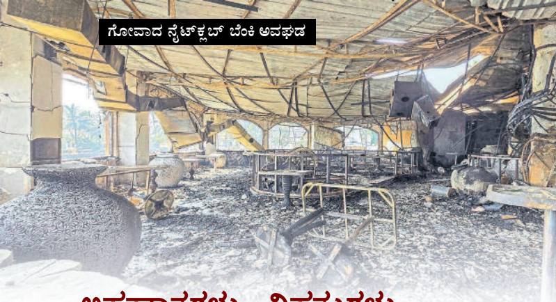
ಗೋವಾದ ನೈಟ್‌ಕ್ಲಬ್ ಬೆಂಕಿ ಅವಘಡ

2008ರ ಸೆಪ್ಟೆಂಬರ್ 8ರಂದು ಮಹಾರಾಷ್ಟ್ರದ ಮಾಲೇಂಗಾವ್‌ನಲ್ಲಿ ನಡೆದಿದ್ದ ಸ್ಫೋಟ ಪ್ರಕರಣದ ಎಲ್ಲ ಏಳು ಆರೋಪಿಗಳನ್ನು ಮಿಲಾಸೆಗೊಳಿಸಿ ಎನ್‌ಐಎ ನ್ಯಾಯಾಲಯ ಜುಲೈ 31ರಂದು ತೀರ್ಪು ನೀಡಿತು. ಆರೋಪಿಗಳ ವಿರುದ್ಧ ಸಾಕ್ಷ್ಯಗಳ ಕೊರತೆ ಇರುವುದನ್ನು ನ್ಯಾಯಾಲಯ ತನ್ನ ತೀರ್ಪಿನಲ್ಲಿ ಉಲ್ಲೇಖಿಸಿತ್ತು.