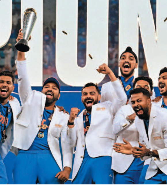
ಭಾರತ ಕ್ರಿಕೆಟ್ ತಂಡ ಚಾಂಪಿಯನ್ಸ್ ಟ್ರೋಫಿ ಜಯಿಸಿದಾಗ

ವರ್ಷ ಹೇಳಿಕೊಳ್ಳುವಂತಹ ಸಾಧನೆಯೇನೂ ಇಲ್ಲ. ಸುನಿಲ್ ಚೆಟ್ಟಿ ನಿವೃತ್ತಿ ನಿರ್ಧಾರ ಹಿಂಪಡೆದು ಬಂದು ಭಾರತ ತಂಡವನ್ನು ಪ್ರತಿನಿಧಿಸಬೇಕಾಯಿತು. ಇಂಡಿಯನ್ ಸೂಪರ್ ಲೀಗ್ ಟೂರ್ನಿಯೂ ಈ ಬಾರಿ ನಡೆಯಲಿಲ್ಲ.