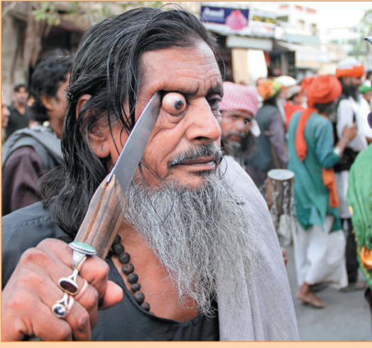
ಅಜೇರ್‌ನಲ್ಲಿ ವ್ಯಕ್ತಿಯೊಬ್ಬನ ವಿಶಿಷ್ಟ ಪ್ರದರ್ಶನವಿದು. ಕಣ್ಣಿಗೆ ಕೈ ಹಾಕುವುದು ಎಂಬ ಆಡುನುಡಿಗೇ ನಿಜವಾದ ಅರ್ಥವನ್ನು ಬಿಂಬಿಸುತ್ತಿದ್ದಾನೆ.